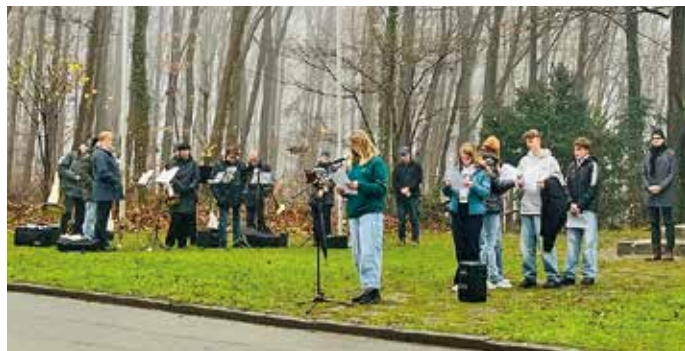
Auch mehrere Konfirmanden aus Bissendorf beteiligten sich aktiv mit ihren Redebeiträgen zum Thema Krieg und Frieden.

Der Kranzniederlegung durch Vertreter der Gemeinde Bissendorf, Volksschützenbund Holte, SoVD Bissendorf-Holte, MGV Fidelitas Holte, Posaunenchor Holte und Schützenclub Hasetal Nemden folgte eine Schweigeminute.