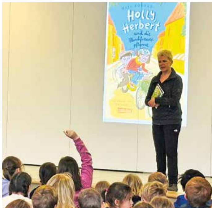
Lesementorin „LiesA“ stellte auf Einladung der Bücherei Bissendorf erstmals eine abwechslungsreiche Lektüreauswahl vor.