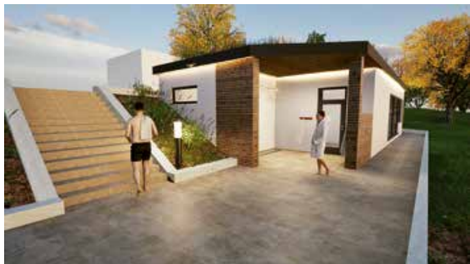
Im Schinkelbad entsteht in den kommenden Monaten eine neue Textilsauna im Außenbereich.