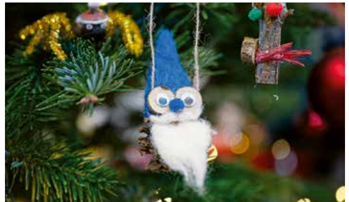
Im Museum am Schölerberg werden Weihnachtsdekorationen aus Naturmaterialien gebastelt.