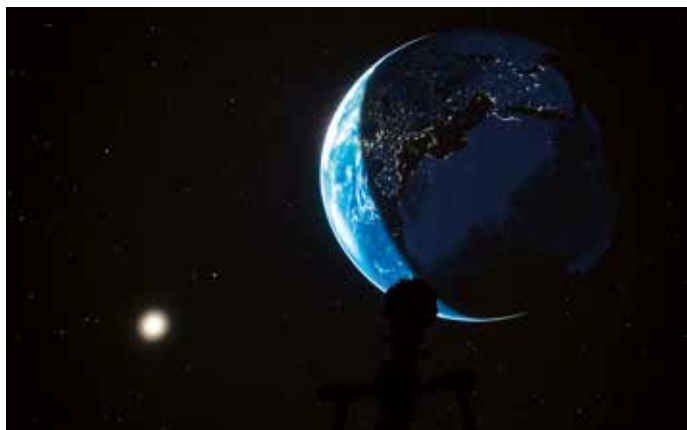
Im Planetarium sieht der Rückblick zum Jahresende auch mal ganz anders aus.

Das Planetarium ist der ideale Ort, um während der Adventszeit zur Ruhe zu kommen und die Gedanken schweifen zu lassen. Besucher der live moderierten Veranstaltung „Advent unter dem Sternenhimmel“ können gleichzeitig den Sternenhimmel genießen, die aktuell sichtbaren Sternbilder kennenlernen und erfahren, welche Planeten zurzeit am Abendhimmel zu sehen sind.