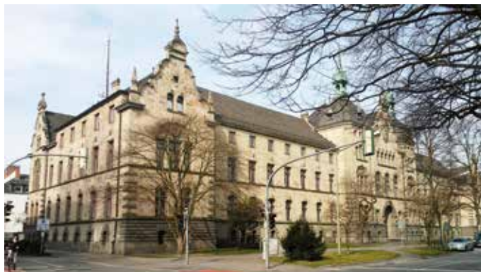
Ehemalige Bezirksregierung – heute Polizeidirektion

Telefon: 0541 2029972 Stadt-Land Führungen Osnabrück