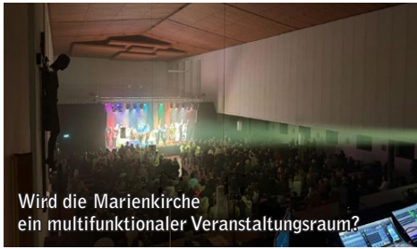
Wird die Marienkirche ein multifunktionaler Veranstaltungsraum?