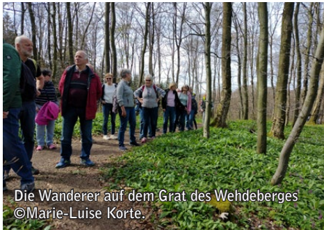
Die Wanderer auf dem Grat des Wehdeberges ©Marie-Luise Korte.

jeweils um 19:30 Uhr. Neben den üblichen Terminen finden im Mai und im September wieder an einem Wochenende freitags und samstags viele Brautpaare den Weg zur Trauung in die Klosterpforte.