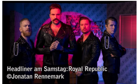
Headliner am Samstag: Royal Republic

Die komplette Tagesaufteilung können Interessierte auf der Website www.huette-rockt.de finden. Das Hütte Rockt Festival 2026 findet vom 6. bis 8.8.2026 statt. Organisiert wird das gesamte Event seit 2006 vom gemeinnützigen