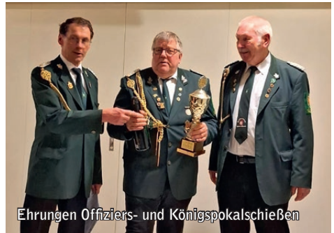
Ehrungen Offiziers- und Königspokalschießen