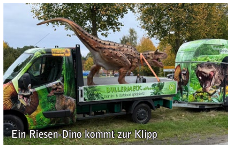
Ein Riesen-Dino kommt zur Klipp

Karussells, Party und jede Menge Kinderspaß: Vom 5. bis 7. Juni lädt der Marktplatz im Herzen von Kloster Oesede während der traditionellen Kloster Klipp wieder zum gemütlichen Bummeln, rasanten Karussellfahrten, Genießen und zum Partymachen ein.