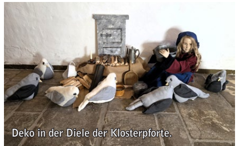
Deko in der Diele der Klosterpforte.

Das Märchen Aschenputtel wurde kindgerecht und lebendig vorgelesen und durch ausgewählte