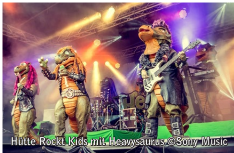
Hütte Rockt Kids mit Heavysaurus

„Emil Bulls“ am Donnerstag, „Das Lumpenpack“ am Freitag, „Royal Republic“ am Samstag: Für Tagesgäste und Fans einzelner Bands steht nun das Programm für jeden der drei Festival-Tage in Georgsmarienhütte fest.