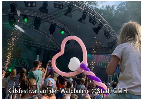
Kidsfestival auf der Waldbühne