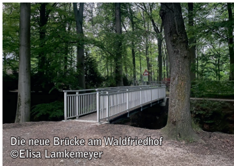
Die neue Brücke am Waldfriedhof

Fünf Jahre lang war sie ein Symbol für Geduld und Behelfslösungen, jetzt ist sie endlich fertig: Die neue Fußgängerbrücke über die Düte am Waldfriedhof. Für die Bürgerinnen und