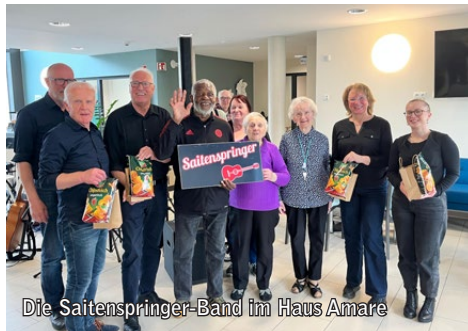
Die Saitenspringer-Band im Haus Amare

Amare im Eingangsbereich der Einrichtung zu einem gemeinsamen Kaffeetrinken. Die Vorfreude war spürbar: Einige Gäste hatten sich besonders schick gemacht, andere wurden von Angehörigen begleitet. Die Erwartungen an einen fröhlichen Nachmittag wurden nicht enttäuscht.